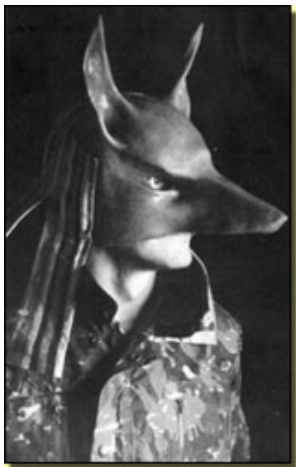
Sol y sombra (1987)

La “camada” de Ernesto Caballero, hijos más cercanos a la incipiente democracia, convivían con temas más a ras de suelo y sus personajes dejaban de ser estilizaciones de los que pululaban por las calles. El y sus compañeros consiguieron estrenar, pero tuvieron que pagar un canon : ser olvidados por el teatro oficial o institucional y llevar sus bártulos a “garitos” -hoy “Salas Alternativas” - dispuestos a recibir una serie de textos que fuesen más allá de aquellas primeras ventanas abiertas.