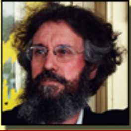
José Ramón Díaz Sande Copyright ©diazsande 2004