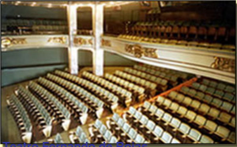
Teatro Fernando de Rojas

Viernes, 26 de Febrero de 2010 14:36 - Actualizado Domingo, 25 de Abril de 2010 16:52