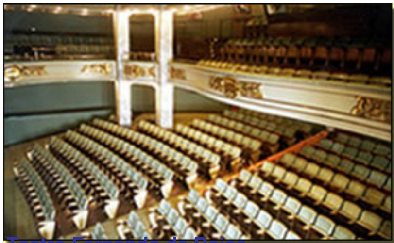
Teatro Fernando de Rojas

Viernes, 26 de Febrero de 2010 14:36 - Actualizado Domingo, 25 de Abril de 2010 16:52