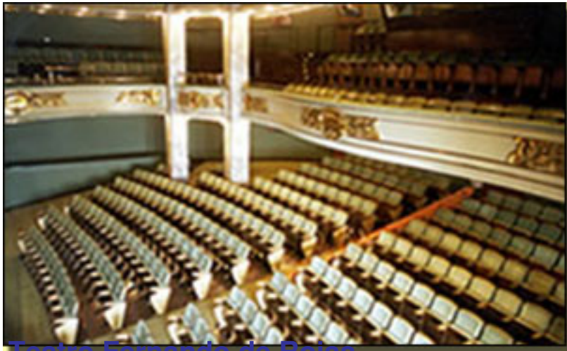
Teatro Fernando de Rojas

Viernes, 26 de Febrero de 2010 14:36 - Actualizado Domingo, 25 de Abril de 2010 16:52