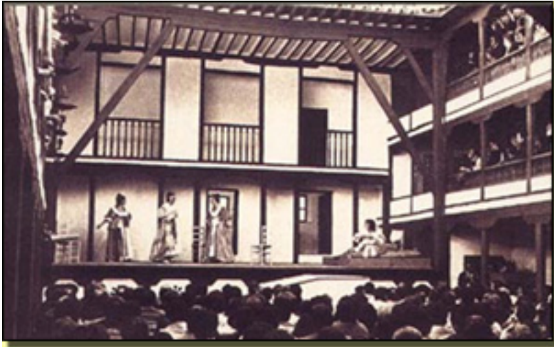
Corral de Comedias

En 1978 se funda el FESTIVAL bajo el título de Jornadas de Teatro Clásico . Son años de preocupación por hacer llegar al público a los clásicos sin polvo, sin tedio y hacerlos inteligibles.