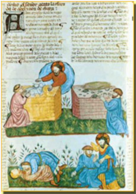
BIBLIA DE LA CASA DE ALBA TRAGEDIA DE CAÍN Y ABEL

Jueves, 25 de Marzo de 2010 17:30 - Actualizado Miércoles, 12 de Mayo de 2010 15:48