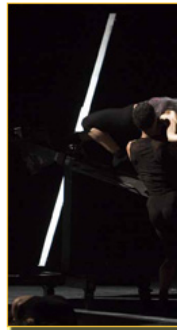
Se agradece esta oportunidad, sobre todo por haber

Nacho , con esta coreografía, se puede decir que elimina lo que tradicionalmente, incluso dentro de la danza contemporánea, se denomina danza, sobre todo si se tiene en cuenta que