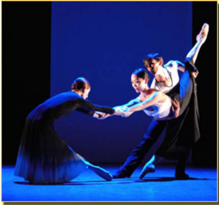
CLARO DE LUNA