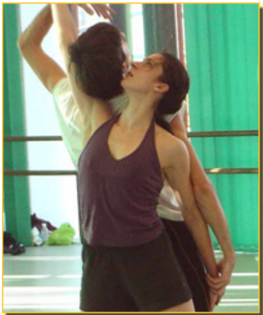
FOTO DE ENSAYO

Un antes y un después porque la Compañía, en sus bailarines, se ha renovado. Algunos, desde hace unos años, triunfan fuera de España. Quienes se han quedado,