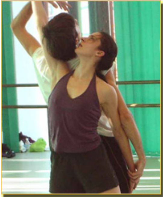
FOTO DE ENSAYO

Jueves, 25 de Marzo de 2010 16:58 - Actualizado Miércoles, 12 de Mayo de 2010 15:57