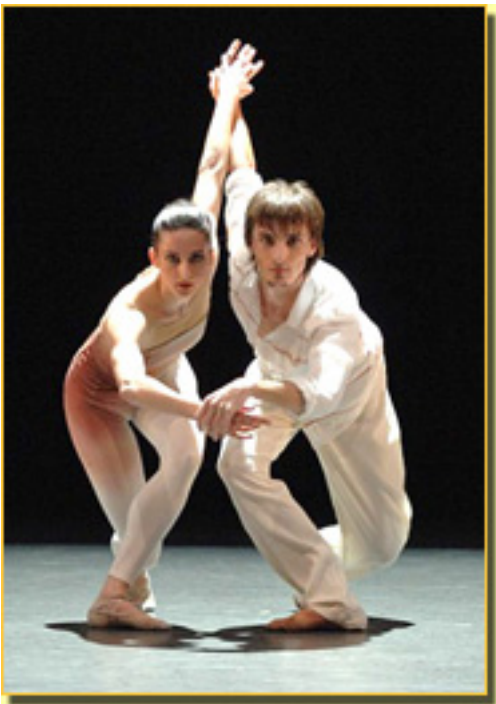
I. BRUSSON/R. VENTOSO