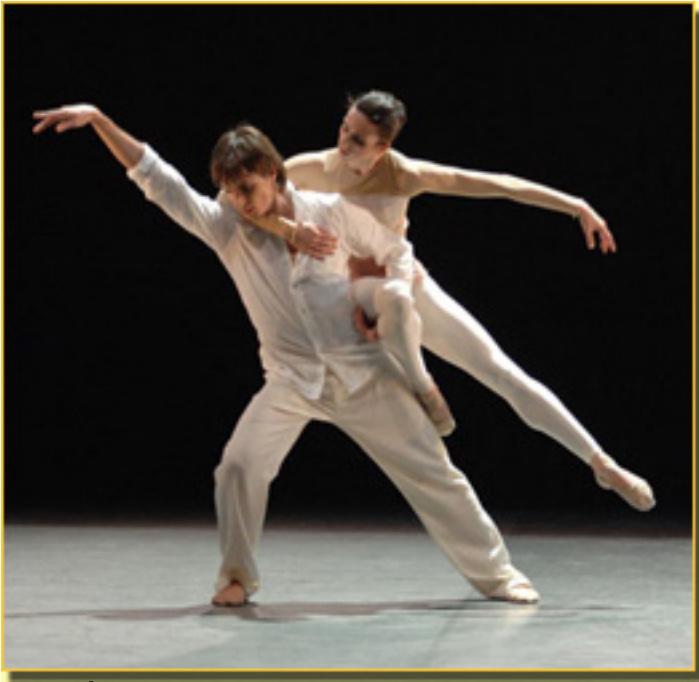
RUBÉN VENTOSO/ISABEL BRUSSON

Jueves, 25 de Marzo de 2010 16:58 - Actualizado Miércoles, 12 de Mayo de 2010 15:57