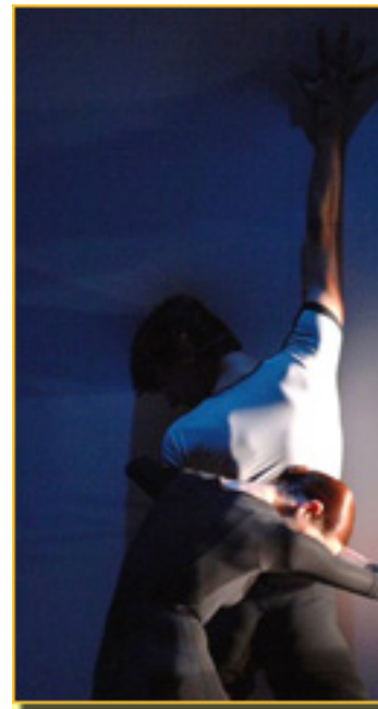
El programa está compuesto por tres