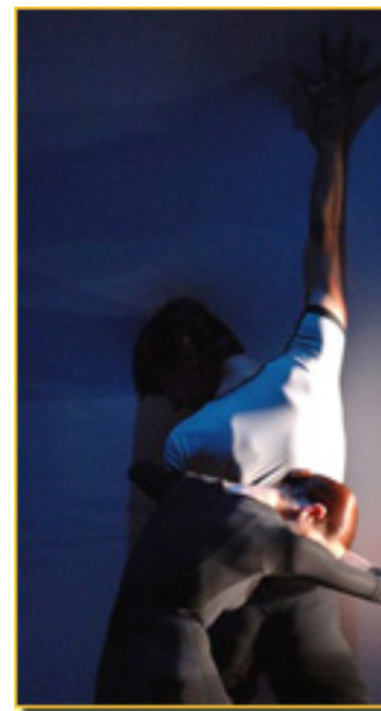
El programa está compuesto por tres