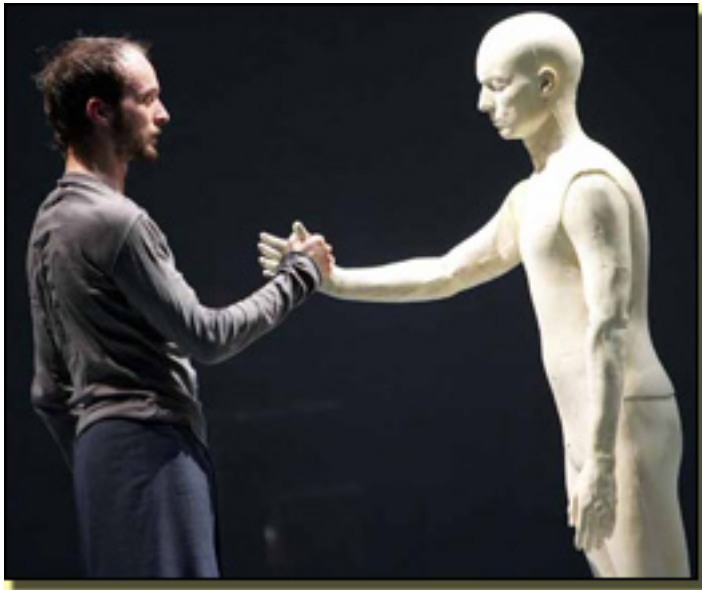
Sidi Larbi Cherkaoui

Martes, 13 de Abril de 2010 19:43 - Actualizado Martes, 11 de Mayo de 2010 09:06