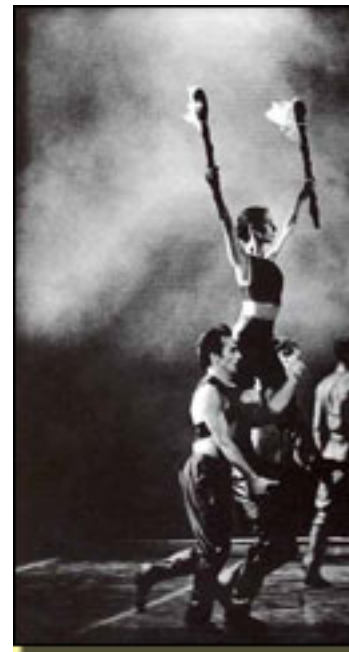
Siete temas - el

localismo colorista de cada una de ellas en tópicos «ninóticos». Un fresco blanquinegro traza los lugares comunes - luminosidad, ludopatía, sensualidad y alegría de vivir- que caracterizan la zona y que responden a lo que se ha dado en llamar «espíritu mediterráneo». Los griegos le adjudicaron un dios: Dionisio.