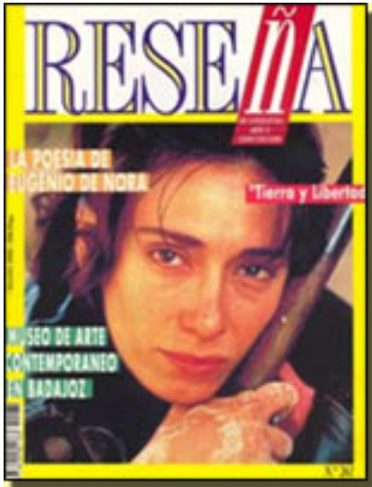
RESEÑA (MAYO 1995) (Nº 261, pp. 22)