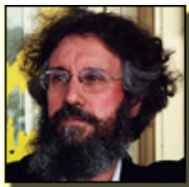
José Ramón Díaz Sande copyright©diazsande

Está construido en cuatro momentos: 2 corales, al principio y al fin, y dos pasos a dos en el medio. Todo rezuma frescura y una gran vitalidad que en el caso de estos jóvenes bailarines, se evidencia más. Es un bonito entretenimiento cercano al juego palaciego, en el que no falta cierto grado de pasión. La parte central - los pasos a dos - es la más impactante en donde se apunta algo de tinte dramático