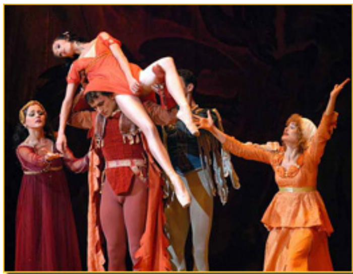
ROMEO Y JULIETA