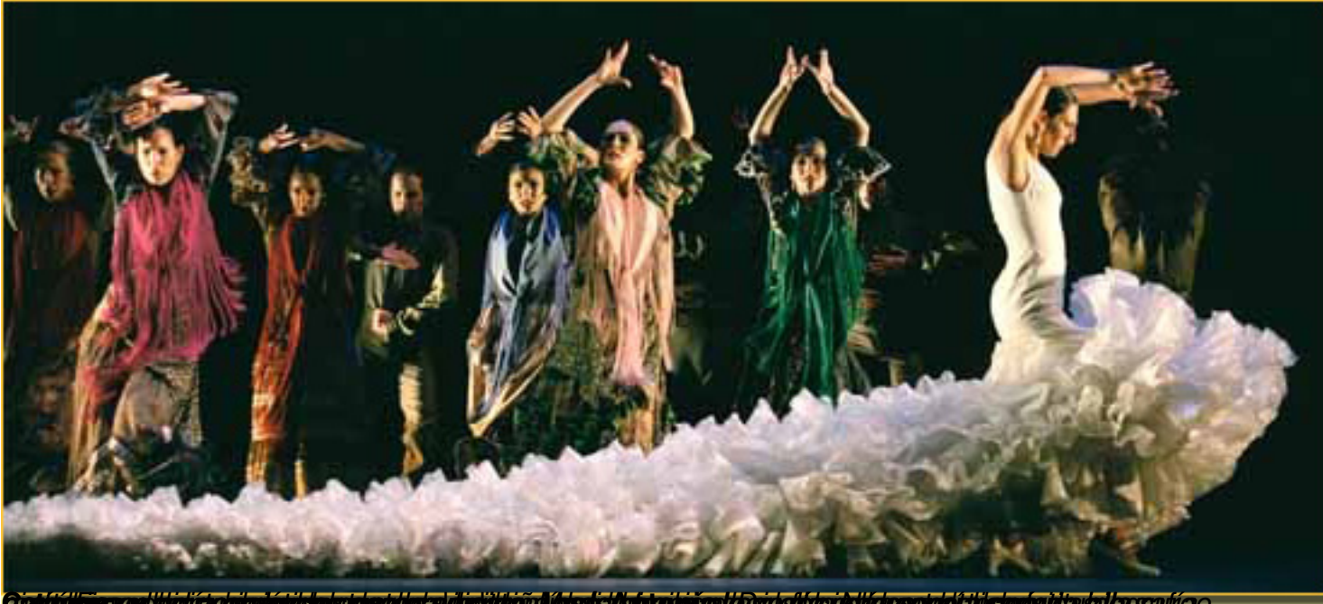
El Ballet Nacional de España en su momento de mayor intensidad. La obra "El flamenco" del Ballet Nacional de España.