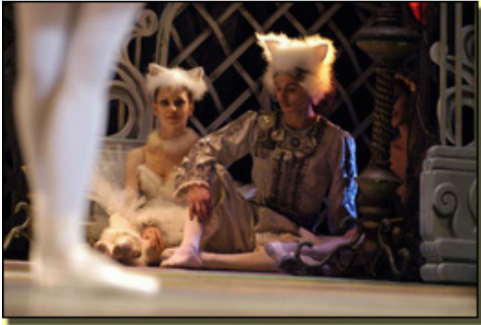
- En este caso contamos Petipa original de La bella durmiente , pero hemos cambiado La bella durmiente más

- En efecto, a pesar de su La Bruja lo rechaza, por Ques de final este es . Lo Xkoles peas oraj as ple de Br Ca Br