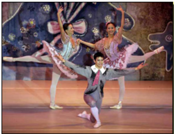
BALLET CLÁSICO DE MOSCÚ B.C.M.

Lunes, 22 de Marzo de 2010 11:51 - Actualizado Martes, 11 de Mayo de 2010 15:36