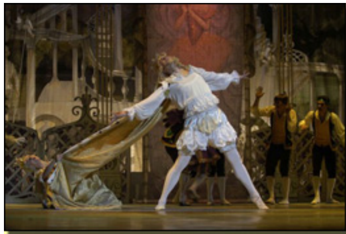
7 / 16

- En efecto, a pesar de su La Bruja lo rechaza, por Ques de final este es . Lo Xkoles peas oraj as ple de Br Ca Br