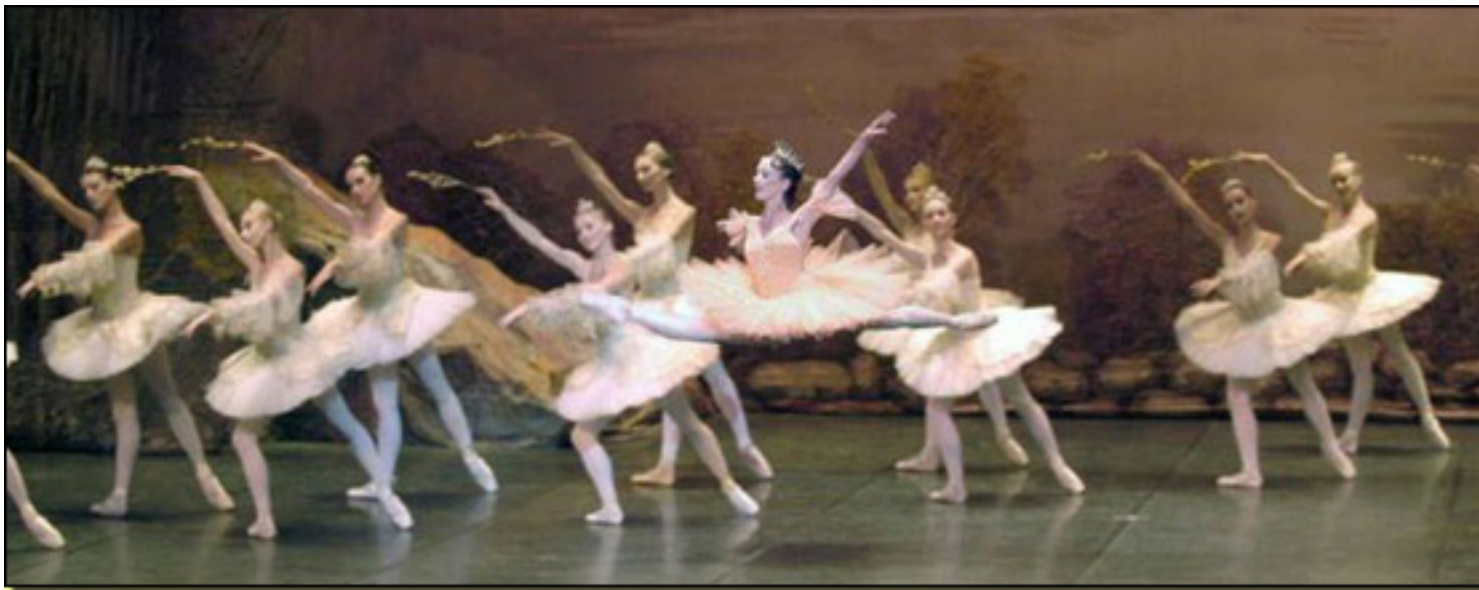
LA BELLA DURMIENTE