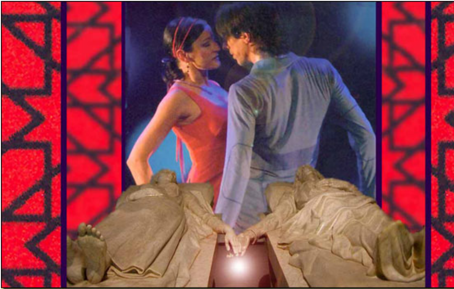
Esculturas de JOSÉ ÁVALOS

Lunes, 22 de Marzo de 2010 11:41 - Actualizado Lunes, 26 de Abril de 2010 09:08