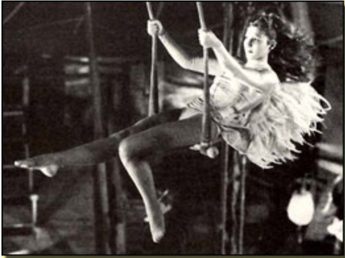
EL CIELO SOBRE BERLÍN (1987)