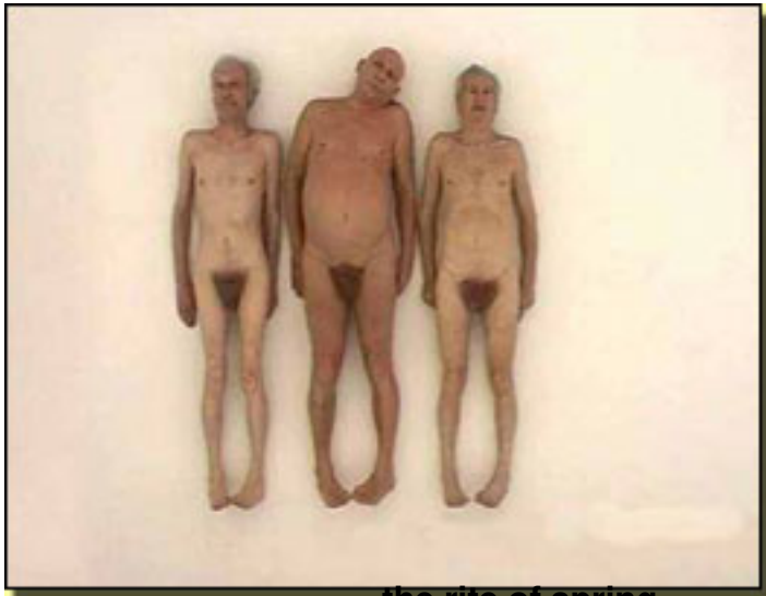
the rite of spring