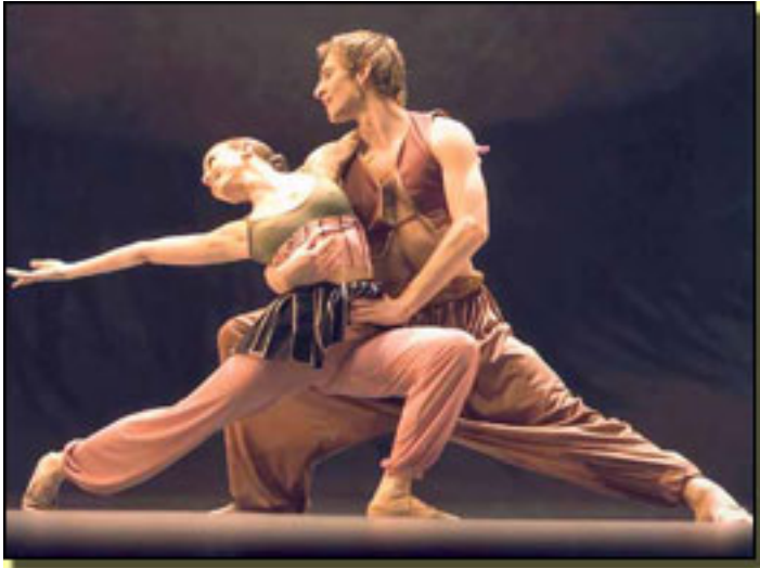
SAMSARA FOTO: J. VALLINAS

La jornada de trabajo en Les Ballets de Montecarlo comienza a las 10.30 horas con la clase de baile clásico hasta las 12.00. Luego a partir de las 12.15 hasta las 14.00 ensayos. Entre 14.00 y 15.00 pausa para un lunch y a partir de las 15.00 hasta las 18.30 otros ensayos.