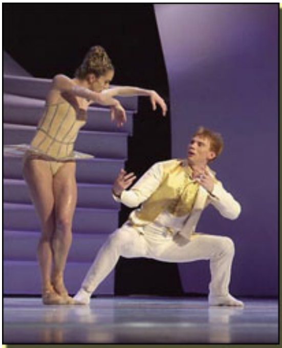
CENDRILLÓN (LA CENICIENTA)