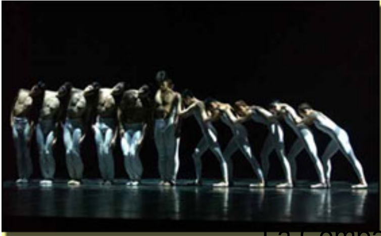
La Compañía Tokyo Asami Ballet en

Cuenta con un repertorio de más de 150 obras que se reparten entre ballets tradicionales japonese de Akiko Tachibana