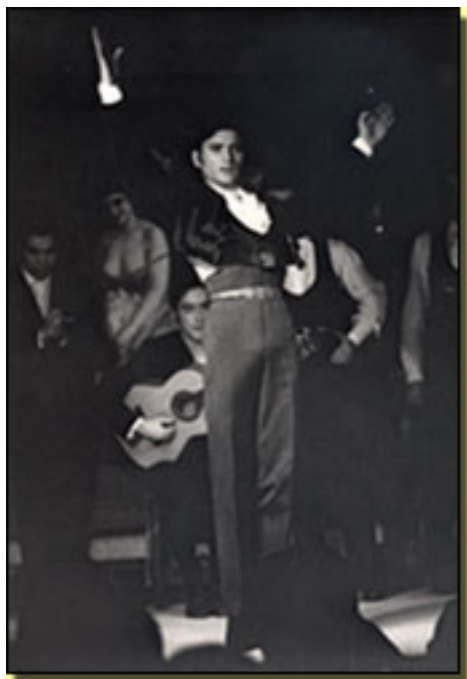
ANTONIO GADES (1962-64) CORRAL DE LA MORERÍA

Lunes, 22 de Marzo de 2010 12:42 - Actualizado Miércoles, 25 de Marzo de 2020 11:44