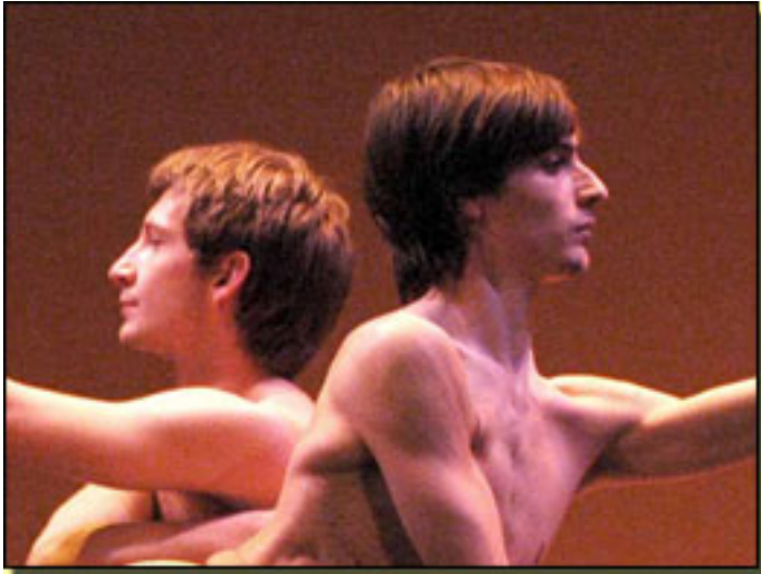
PIOTR CZUBOVICZ/RUBÉN VENTOSO

“Cuando nos sentimos responsables, implicados y comprometidos experimentamos una profunda emoción, un gran valor”