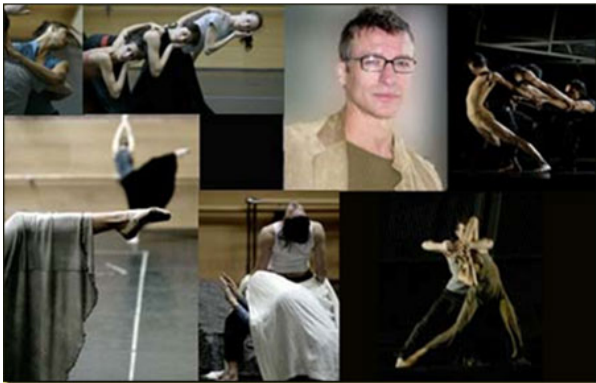
NACHO DUATO: 15 AÑOS (1990 – 2005) DIRIGIENDO LA COMPAÑÍA NACIONAL DE DANZA