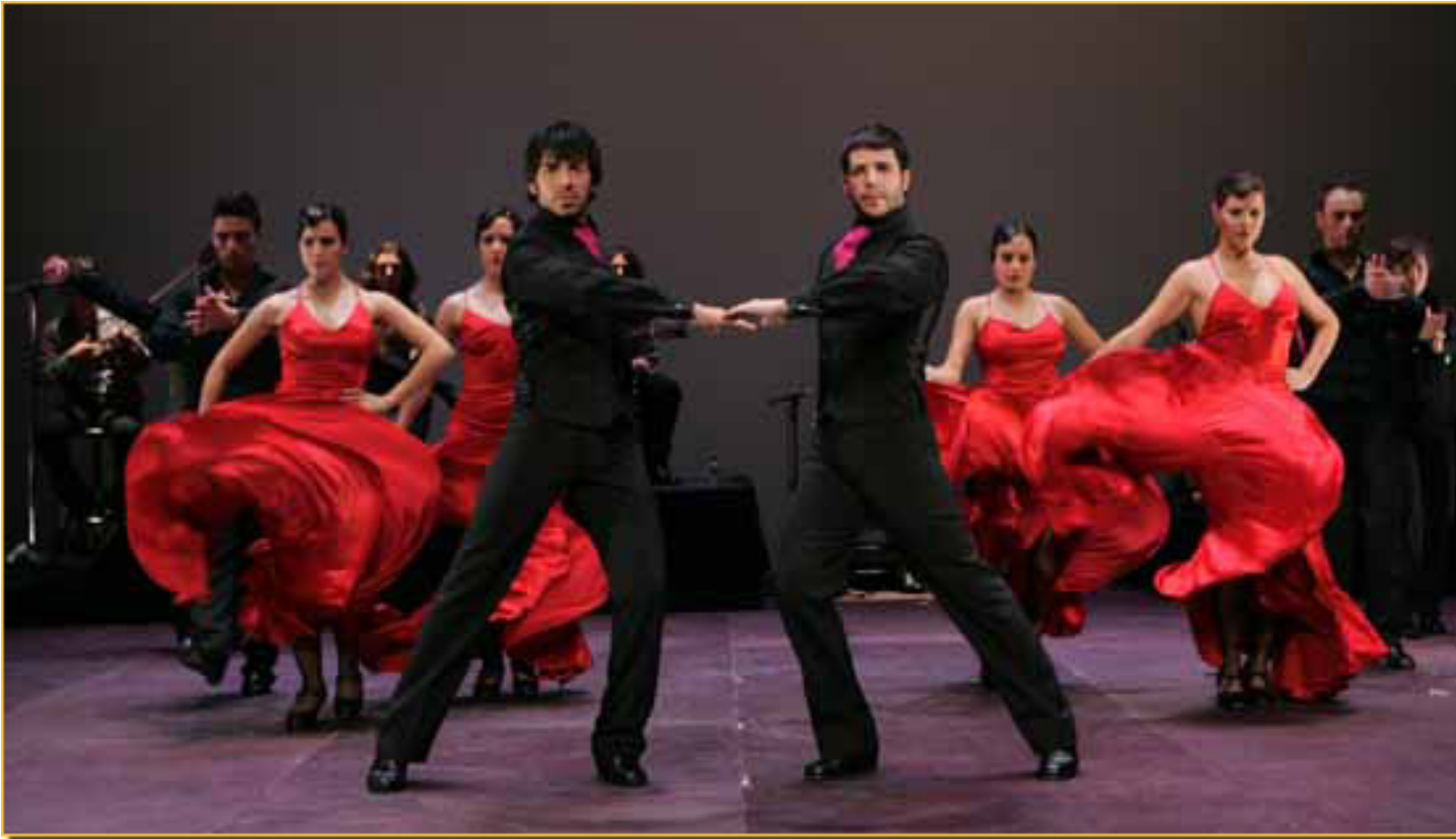
ROJAS & RODRÍGUEZ y la COMPañía