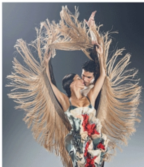
ALENTÓ & ZAGUÁN