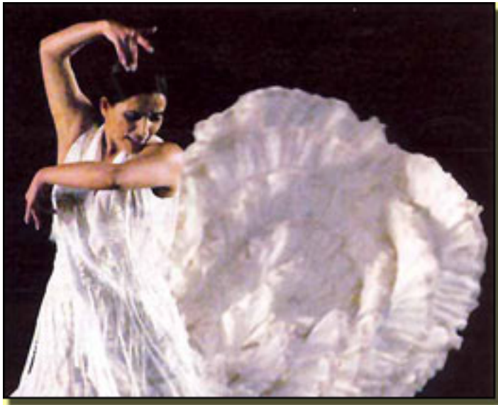
- El momento crucial de mi vida cuando me di cuenta de que estaba en un camino equivocado.