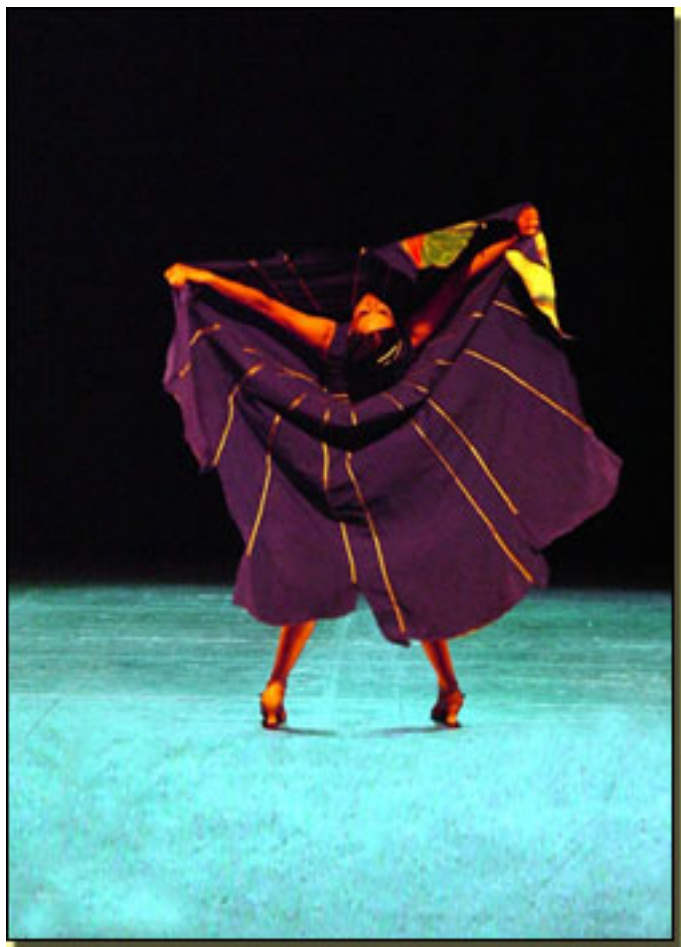
Teatro Albéniz 20:30 Horas

Lunes, 12 de Abril de 2010 08:28 - Actualizado Domingo, 09 de Mayo de 2010 19:44