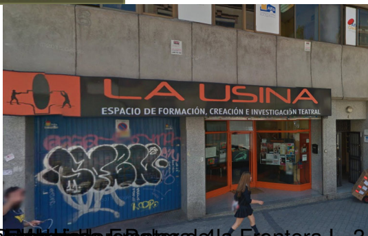
Crédito: José R. Díaz Sande