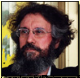
Consejero de Hacienda y Sanidad