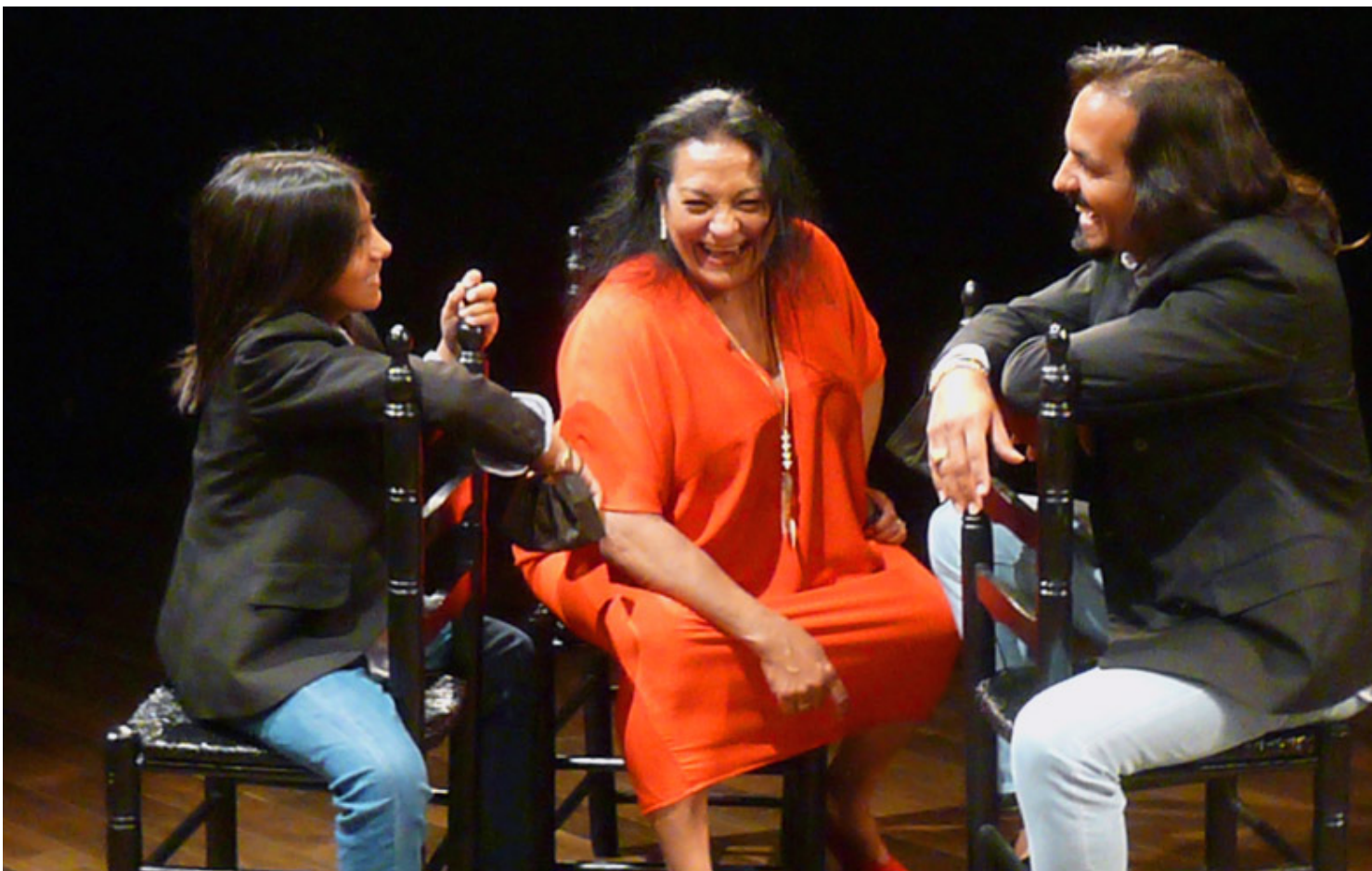
JUAN EL MORENO / LA FARRUCA / FARRUQUITO

FARRUQUITO, ▯ LA FARRUCA, ▯ JUAN “EL MORENO” (hijo Farruquito)