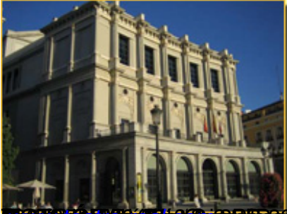
www.legajo-real.com by Trzeciak