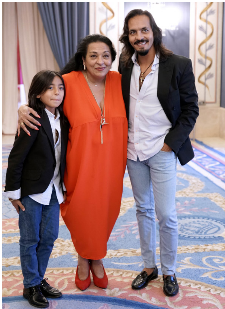
JUAN EL MORENO / LA FARRUCA / FARRUQUITO