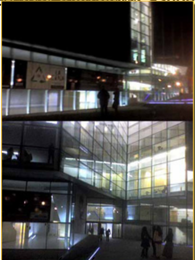
Edificio de la memoria, ahora abierta al público