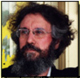
Convención de la memoria