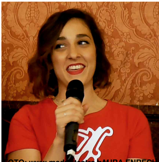
MIRA ENFERMERA

Lunes, 25 de Febrero de 2019 19:22 - Actualizado Martes, 26 de Febrero de 2019 17:33