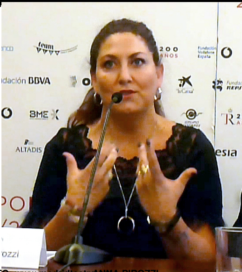
ANNA PIROZZI