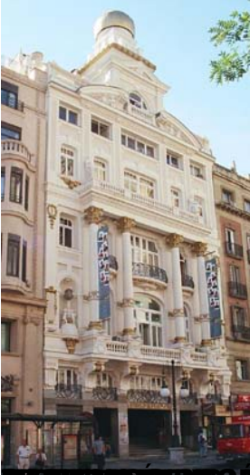
TEATRO DE LAS CORTES, PLAZA DEL REY