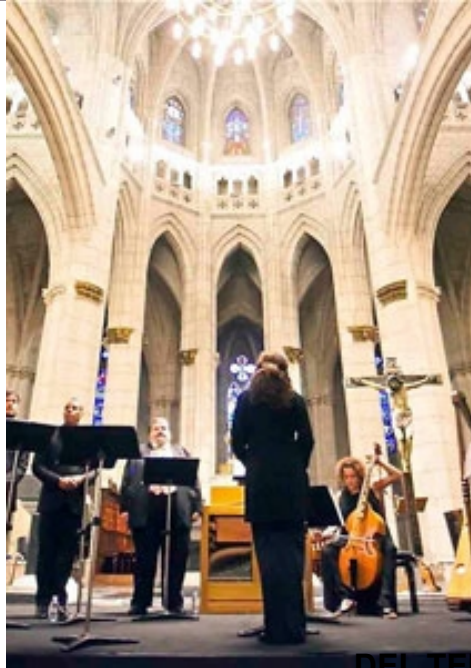
DEL TEMPLO AL TEATRO