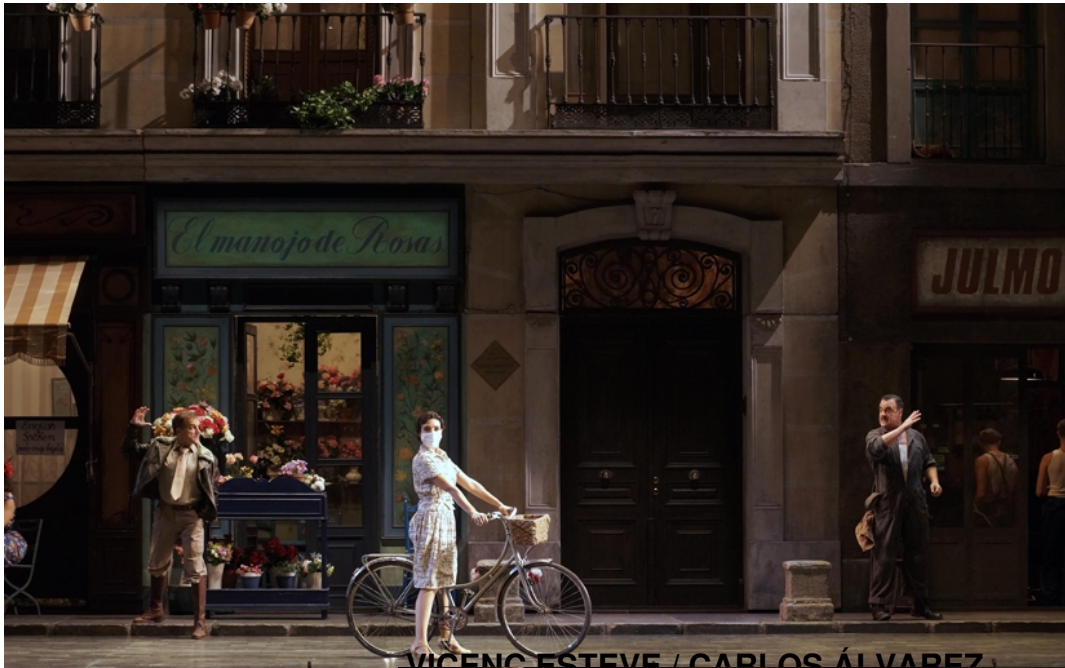
VICENÇ ESTEVE / CARLOS ÁLVAREZ

Martes, 10 de Noviembre de 2020 15:27 - Actualizado Martes, 10 de Noviembre de 2020 22:40