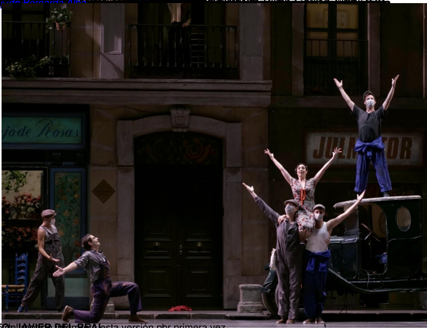
El momento de la victoria en esta versión por primera vez.