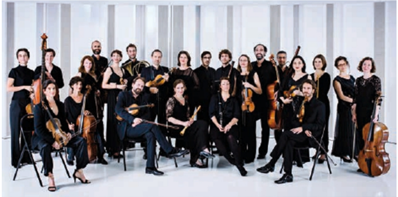
LE CONCERT DE LA LOGE