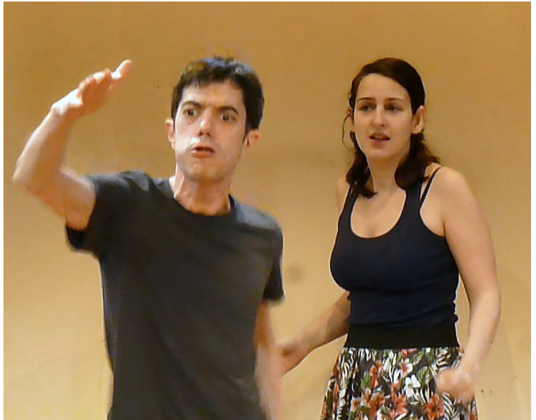
GILLEM MOTOS / MARTA ARÁN