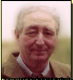
Copy Jerónimo López Mozo

Viernes, 13 de Marzo de 2015 18:44 - Actualizado Viernes, 13 de Marzo de 2015 19:14