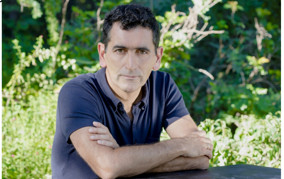
EL SEÑOR DE LOS ANGELES, de Juan Manuel Bustoz, en el Teatro de la Catedral de Madrid. Foto: Juan Manuel Bustoz