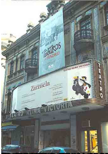
Exterior del Teatro Reina Victoria, Plaza de Santa Ana, Sevilla