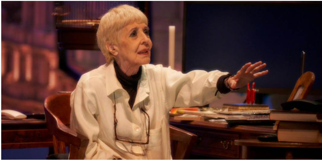
CONCHA VELASCO