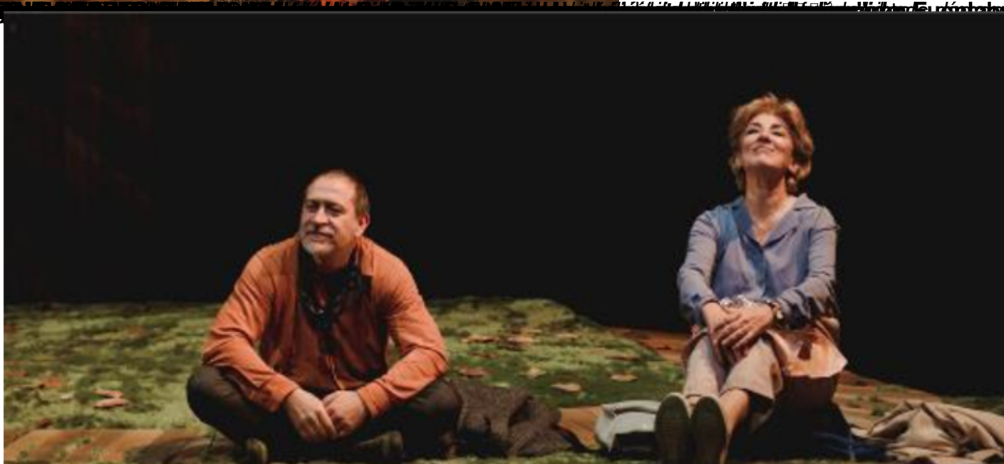
FOB/INT ROBERTO PEREZ ORDÁZ (directora de produccióndiunthronkaintdntnola Te