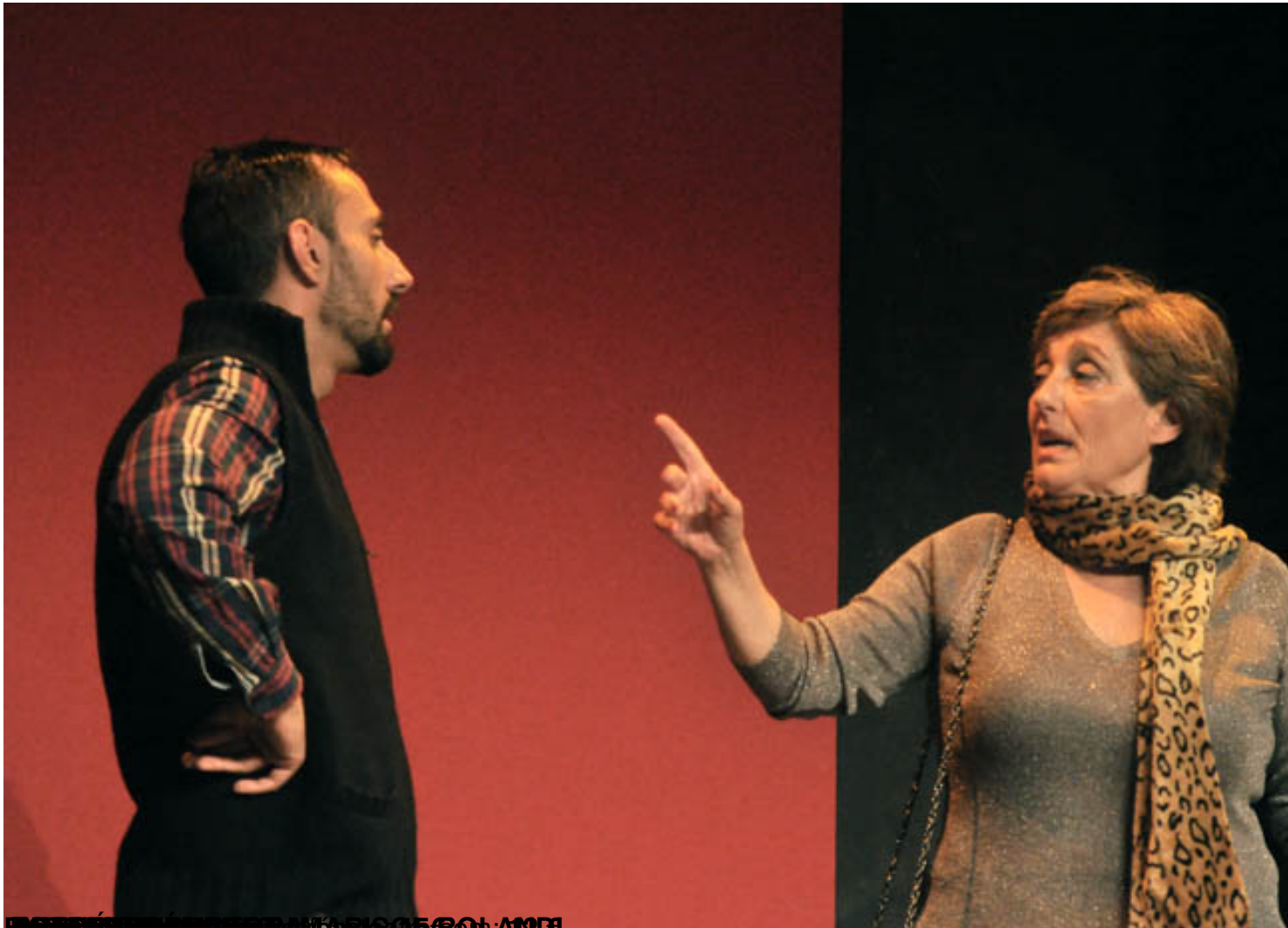
El espectáculo se representa en el Teatro de la Latina