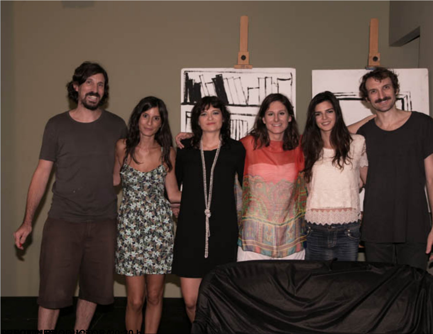
Jueves 11 de Septiembre de 2014

Lunes, 15 de Septiembre de 2014 09:33 - Actualizado Lunes, 15 de Septiembre de 2014 10:24