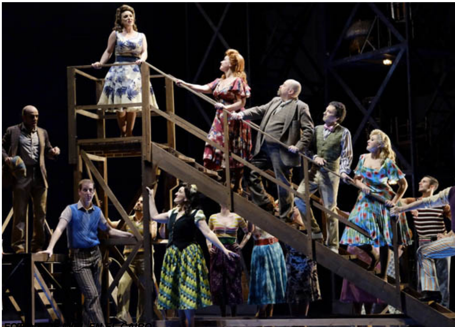
LUNA DE MIEL EN EL CAIRO

Sábado, 31 de Enero de 2015 18:43 - Actualizado Miércoles, 11 de Febrero de 2015 18:46