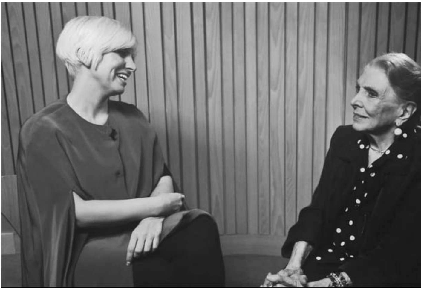
PASIÓN VEGA / MARÍA DOLORES PRADERA