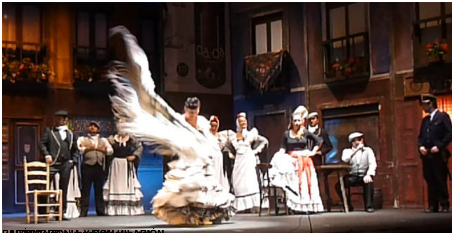
BARCELONA y BILBAO

Viernes, 22 de Agosto de 2014 15:47 - Actualizado Viernes, 22 de Agosto de 2014 22:57