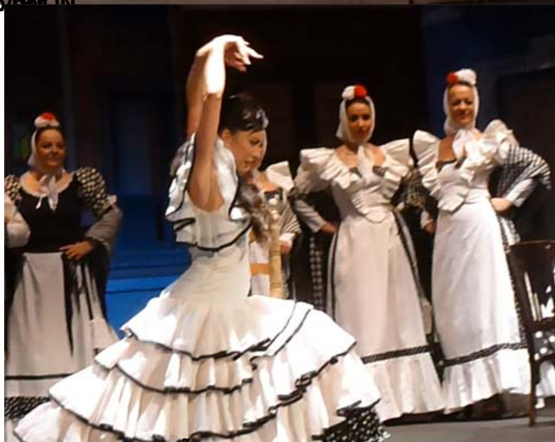
BARCELONA y BILBAO