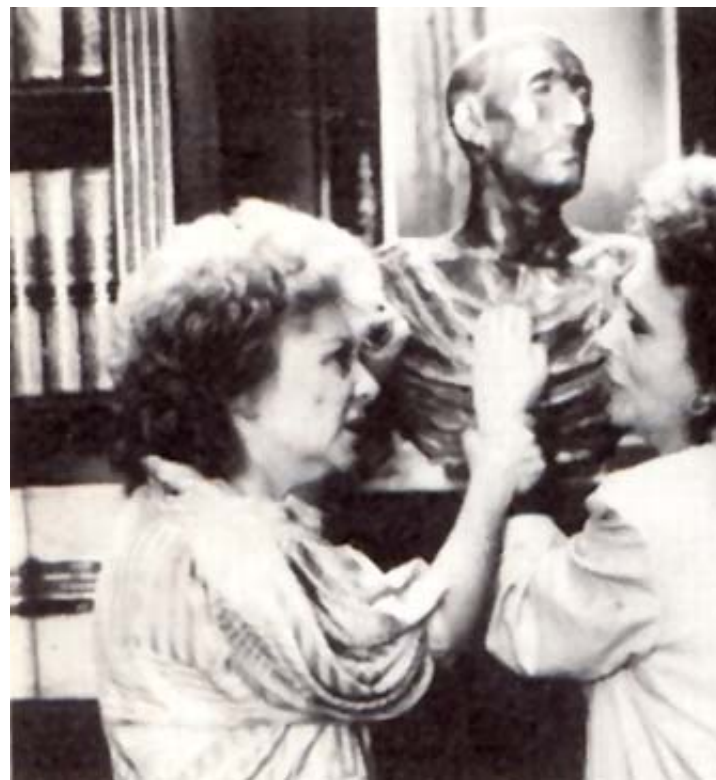
AMPARO SOLER LEAL / AMPARO RIVELLES