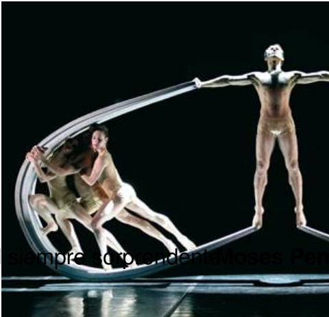
El siempre sorprendente y maravilloso Fen