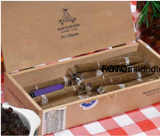
PUROS HABANOS