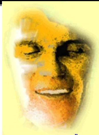
JOSE MANUEL DIAZ SANDE El divorcio de Fígaro. Ödön von Horváth