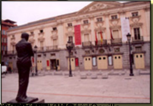
Escultura de Ödön von Horváth en Sevilla.