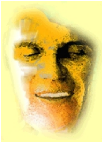
CARMEN MACHI

www.madridteatro.net Juicio a una zorra Arco-Machi. Entrevista